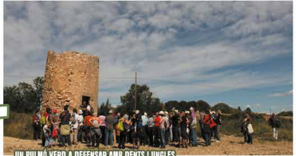
UN PULMÓ VERD A DEFENSAR AMB DENTS I UNGLES

“Un Ortoll lliure de ciment, asfalt i pisos passa per una requalificació del territori, tant la zona 1 com la 2, cap a sòl desqualificat.”