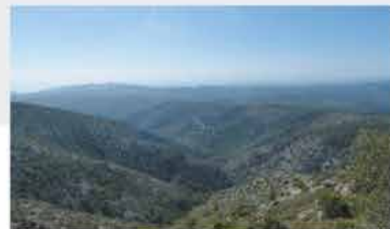
Foto: el Massís del Garraf

El massís del Garraf es troba inclòs dins del Decret del Pla d'Espais d'Interès Natural (PEIN) de la Generalitat, així com de la Xarxa Europea Natura 2000 com espai per hàbitats d'interès comunitari i espècies d'ocells i altres grups protegides en l'àmbit europeu. Tot i els seus innegables valors naturals, el territori paga el preu d'estar just al pati del darrere de Barcelona . Als enormes impactes de pedreres, abocador o línies elèctriques, s'ha de sumar la pressió humana, la contaminació atmosfèrica, lumínica i hídrica, i una insuficient inversió de les administracions públiques en la seva conservació. El massís, així mateix, pateix el dèficit històric de no haver estat declarat formalment com a Parc Natural , d'acord amb la Llei 12/1985 d'espais naturals de la Generalitat de Catalunya. Igual com la resta de pedreres i activitats industrials impròpies d'un espai protegit, la cimentera actual de Vallcarca és una profunda ferida al Garraf. Qualsevol projecte que es plantegi ha de basar-se a eliminar l'edificació i reintegrar l'espai a l'entorn natural del Garraf .