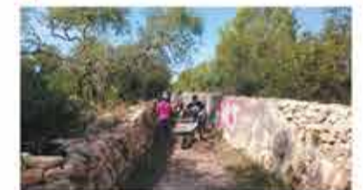
Mulasses, molins i marges de pedra seca.