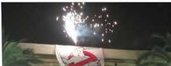
Foto: senyala i paranta a la Plaça de la Vila.