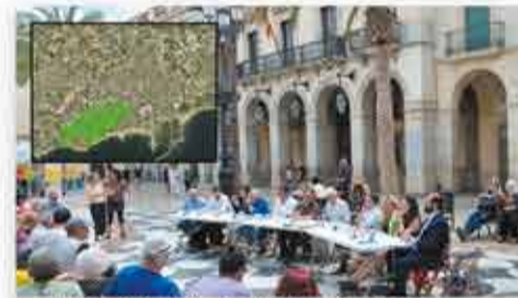
Debat de campanya sobre ecologia.

Segons una enquesta realitzada per vilanova.blog, el 97% de vilanovins i vilanovines s'oposarien a l'edificació de l'Ortoll; si girem la mirada cap a la institució, a un acte organitzat per la Coordinadora d'Entitats pel Clima durant la campanya de les municipals del 2023, d'entrada, cap partit s'atreveix a parlar en contra de la protecció de l'Ortoll, excepte el Partit Popular, que deixa clar en seu compromís amb la iniciativa privada del mercat immobiliari. Ara bé: no cal deixar-se enganyar. Aquesta aparent unanimitat respecte la defensa de l'Ortoll com a pulmó verd no sempre ha existit; de fet, és fruit de molts anys de pressió i campanyes destinades a socialitzar allò de "L'Ortoll no es toca".