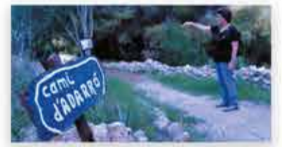
Recuperació del més de 4.6km del circuit del Camí d'Adarró

Foto 1: mur de pedra a l'Ortoll, enllestida Foto 2: Horts comunitaris Foto 3: Camí d'Adarró