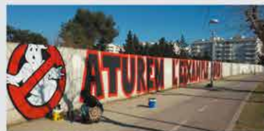
Foto: mural a la Ronda Ibèrica.

"Aturem l'Eixample Nord" és una plataforma ciutadana que es va formar amb l'objectiu de frenar el projecte urbanístic conegut com a Eixample Nord i conscienciar la població de les seves conseqüències (mediambientals, urbanístiques i demogràfiques); va néixer a principis de 2015, sent una de les seves accions inicials la recollida de signatures per exigir una audiència pública sobre l'Eixample Nord. La preocupació general era evident: hi mancava informació per totes bandes i el veïnat volia un debat públic. Tant per l'afectació als horts i terrenys naturals de la zona, com per la preocupació per la manca de planificació pel creixement urbanístic que suposava i els especuladors immobiliaris que de ben segur en treurien profit d'aquest macroprojecte, de seguida el debat va irrompre en l'escena pública. Ara farà gairebé una dècada, aquesta plataforma va engagar una campanya que deia "No als barris fantasma", emprant d'imatge una paròdia dels "Cazafantasmas".