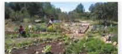
Horts comunitaris i activitat agrícola.