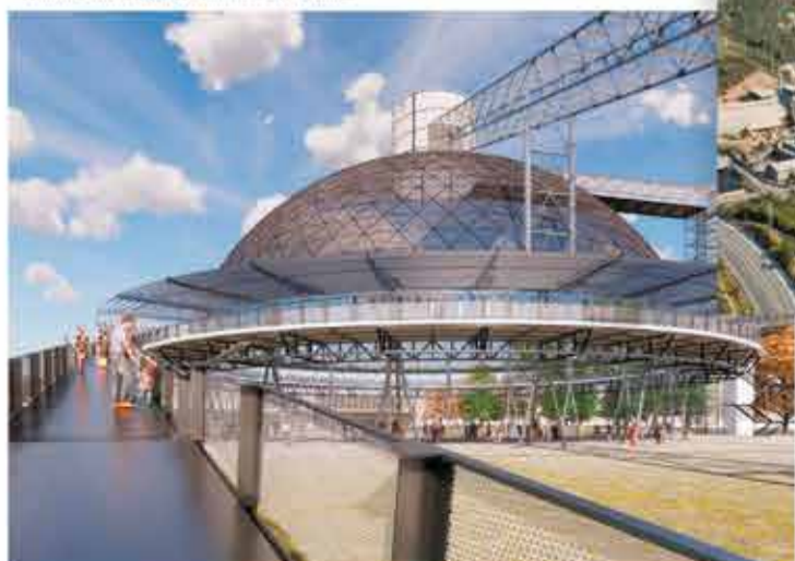
Foto: espai polivalent previst per activitats d'oci. Vallcarca Nest

En un entorn sense escapatòria, aquest projecte ignora el risc extrem d'incendi de l'entorn de Vallcarca.