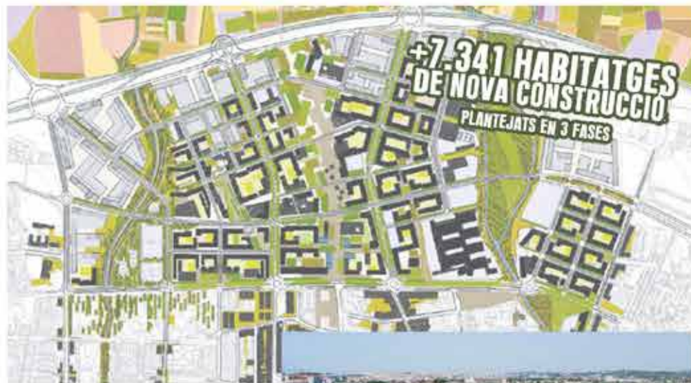
Foto 1: projecte de l'Eixample Nord pel proper POUM (a dalt) Foto 2: zona de l'Eixample Nord sense urbanitzar. Carles Castro.

“Cal planificar el creixement urbà segons les necessitats reals de la ciutat: cal començar per equiparar serveis, no tirar endavant macroprojectes urbanístics”