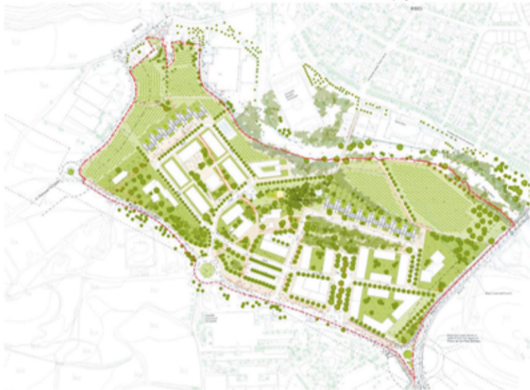
Foto: projecte urbanístic de Can Jove.

A més a més, el corredor fluvial que passa per la part de ponent del nucli principal de Sant Pere de Ribes és de vital importància per a la connexió entre els espais PEIN que formen part de la Xarxa Natura 2000. La riera de Ribes ressegueix la vora nord d'aquest sector, i al cap de mil metres desemboca al tram de la riera que forma part de la Xarxa Natura 2000. Aquest tram de riera que passa pel sector recull les aigües del torrent de Can Puig i del torrent de Sant Pau i, sobretot, de la riera de Begues i la riera de Vilafranca.