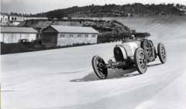
Foto 1: arxius del Pla General d'Ordenació Urbana. Foto 2: vista aèria, ADR.

Un projecte especulatiu: Es tracta d'una operació urbanística d'alt impacte sobre l'entorn natural del conjunt de la comarca